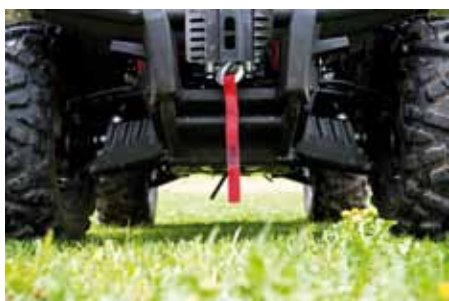
Vinsch fram är obligatoriskt på en sån här stor maskin och dessutom sitter den väl skyddad.