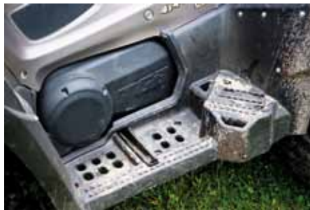
Motorn tar sin plats på bredden men det finns ändå gott om plats för två fötter.