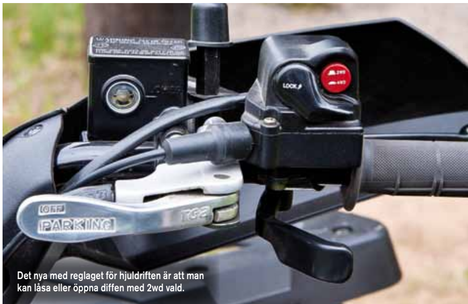
Det nya med reglaget för hjuldriften är att man kan låsa eller öppna diffen med 2wd vald.