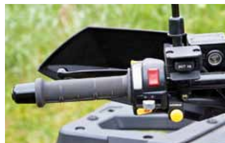
Här sitter de övriga knapparna man bör hålla koll på som blinkers, lysknappar och vinschknapp med mera.