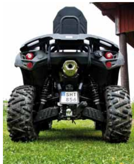
Draget sitter där tillsammans med släpvagnsuttag och utblåset är placerat i mitten.