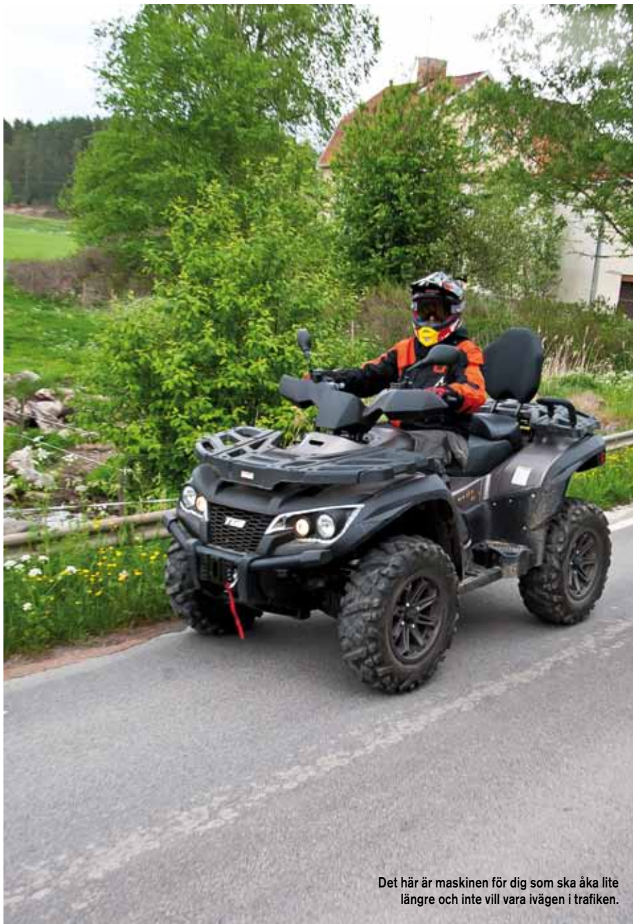
Det här är maskinen för dig som ska åka lite längre och inte vill vara ivägen i trafiken.

drar iväg efter vägen med detta kraftpaket känner man helt klart att maskinen fått säkrare köregenskaper, speciellt när det är vått eller på grus. Dessutom möjliggör det för bakhjulen att rulla olika snabbt i kurvorna vilket minskar däckslitage. Apropå däckslitage så upplevde vi att motorbromsen fungerade mycket bra på vägen för att få ner farten inför kurvorna men precis innan man står helt still låste den faktiskt bakhjulen ibland på lösare underlag. Inte så kraftigt att man får sladd men ändå något att tänka på om det är vått ute. Om man låser upp diffen bak och kör med ett hjul får man en svängradie på 4,23 meter medans den blir 4,74 om man låser diffen! Ytterligare en detalj som blivit bättre med diffen bak. Rent komfortmässigt sitter man riktigt bra både fram och bak på TGB Blade 1000 även om motorn tar sin plats på bredden. Även dämparna bidrar och passar utmärkt efter vägen med sin lite hårdare karaktär.