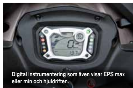
Digital instrumentering som även visar EPS max eller min och hjuldriften.