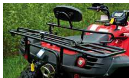
Både när det gäller ryggstödet och lastracken är det ganska stor skillnad på STD- och SE-modellen.