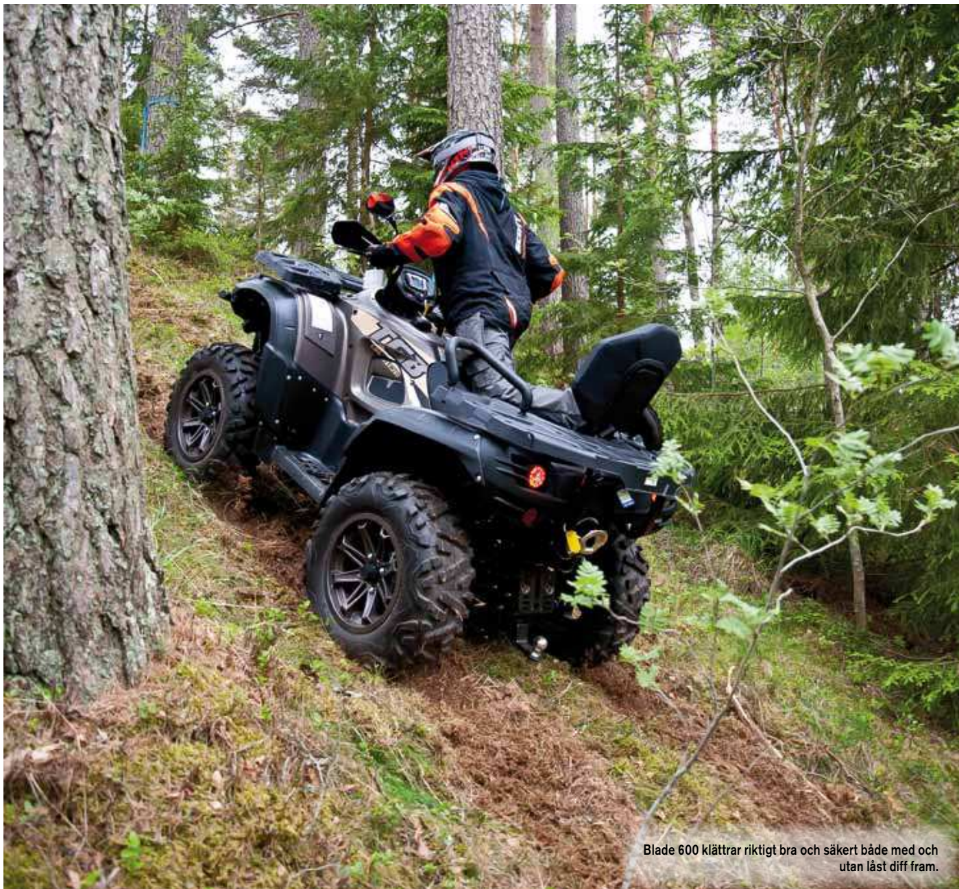
Blade 600 klättrar riktigt bra och säkert både med och utan låst diff fram.

fordon. Nya TGB Blade 600 gör nästan på pricken just 50 km/h, vilket räcker gott och väl för det man bör använda fordonet till, arbete. Av någon anledning har man typat in detta fordon med 19kW vilket motsvarar 25,5 hästar och vi har sett att flera andra tillverkare gör detta på sina traktormodeller, osäkert varför och något vi får återkomma till. Här sitter det mesta av denna strypning i gashandtaget i form av en skruv och det är ganska stor skillnad om den sitter där eller inte kan vi avslöja. Euro 4 är de nya reglerna som gäller från årsskiftet för ATV och MC. För denna TGB 600 betyder det följande. Denna har endast vänster bromshandtag som Traktor B, som väggreggad har 600:an dessutom dubbla bromsok bak istället för ett placerat på drivaxeln som på traktorn. När vi ändå är inne på bromsarna så finns det även en ny stor varningslampa för bromsarna och dessutom är oljebehållaren större än tidigare. Allt för att uppfylla Euro 4-kraven. Även knapparna för hjuldriften kommer ändras på dessa fordon, men nu var det Traktor B