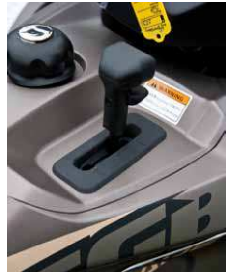
Växellådan har fått ett P-läge och man måste hålla inne en spärr på knoppen för att växla.