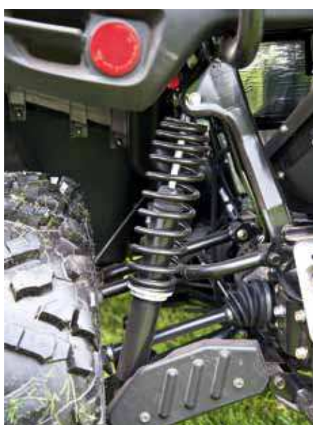
Detsamma gäller dämparna bak och även här sitter det A-armsskydd.