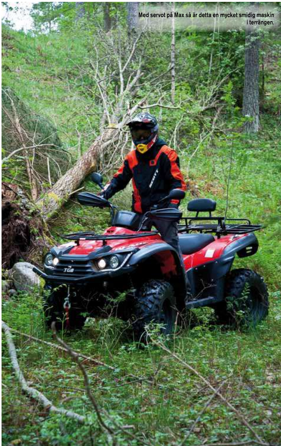
Med servot på Max så är detta en mycket smidig maskin i terrängen.