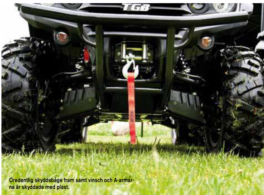
Oredentlig skyddsåbåge fram samt vinsch och A-armarna är skyddade med plast.