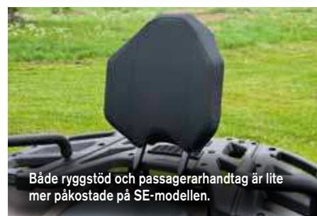
Både ryggstöd och passagerarhandtag är lite mer påkostade på SE-modellen.

Valet mellan en standard eller SE-modell hänger mycket på hur stor plånboken är. Är det bara arbete man ska göra kommer man väldigt långt med standard-modellen, men satsa på den med servo!