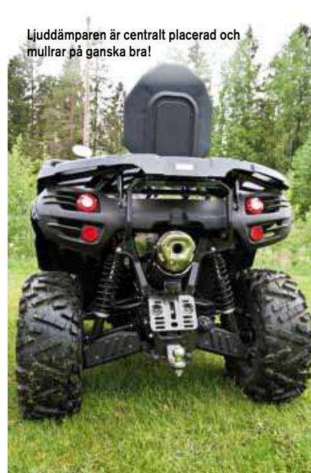
Ljuddämparen är centralt placerad och mullrar på ganska bra!