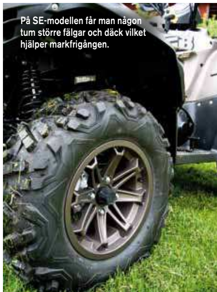
På SE-modellen får man någon tum större fälgar och däck vilket hjälper markfrigången.