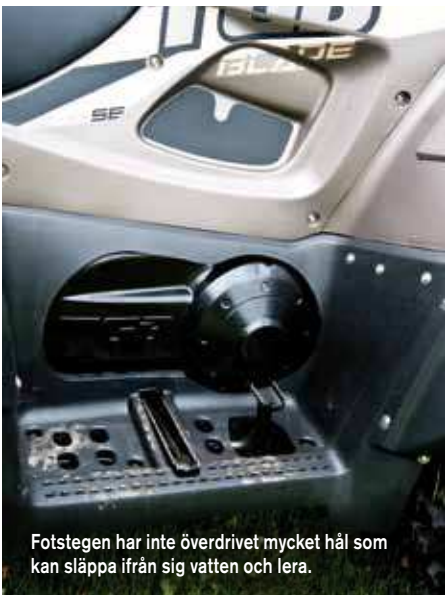
Fotstegen har inte överdrivet mycket håll som kan släppa ifrån sig vatten och lera.