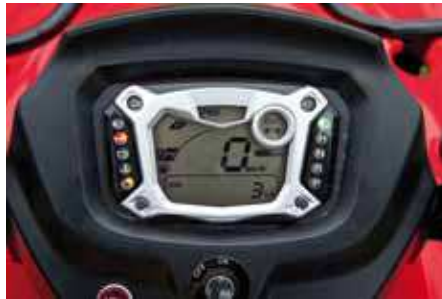
Mycket lätt att manövrera sig runt bland menyerna och ställa in vad som ska visas.