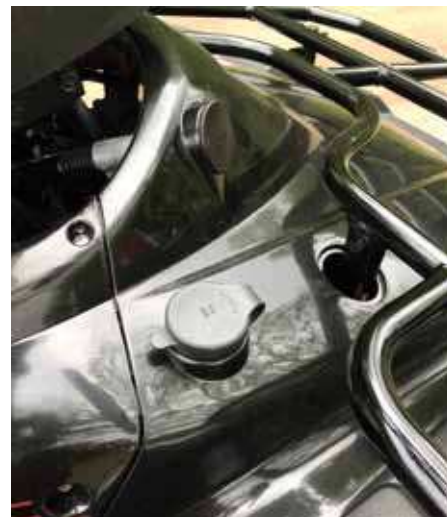
Även på utsidan finns det möjlighet att använda ett 12V-uttag.