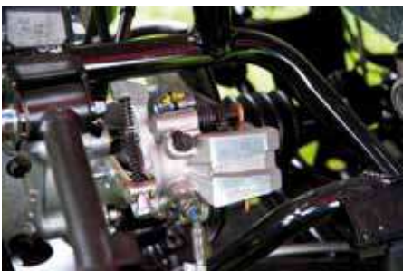
Som Traktor B har den en hydraulisk broms bak istället för två.