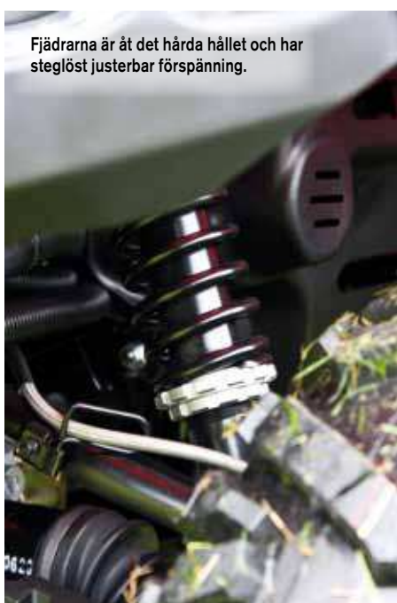
Fjädrarna är åt det hårda hållet och har steglöst justerbar förspänning.