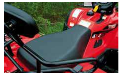
Dynan är hård i sin stoppning och har en väldigt platt utformning.